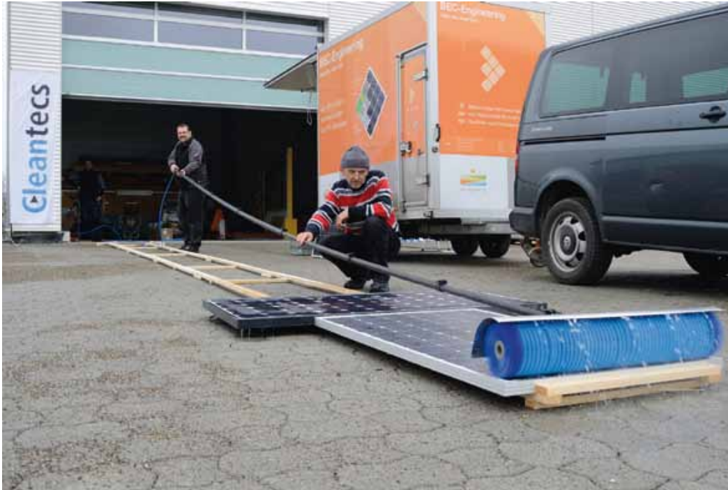
Abbildung 1: Darstellung des Modulreinigungsvorgangs mit Reinigungsgerät C700